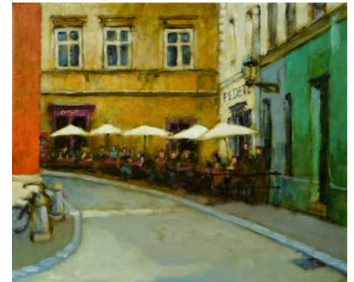
10. Zaulek niewiernego Tomasza