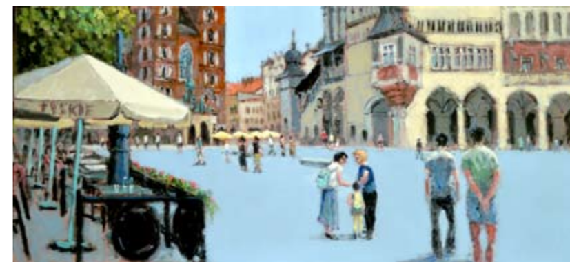
11. Rynek Główny