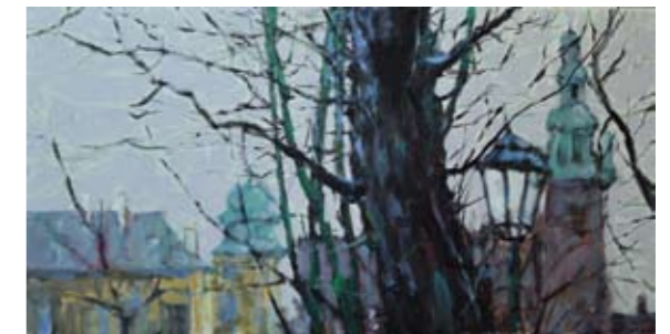
8. Planty - Wawel