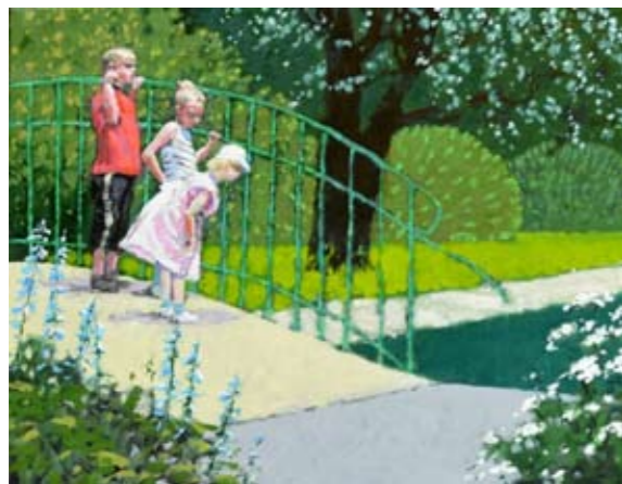
1. Mostek na Plantach