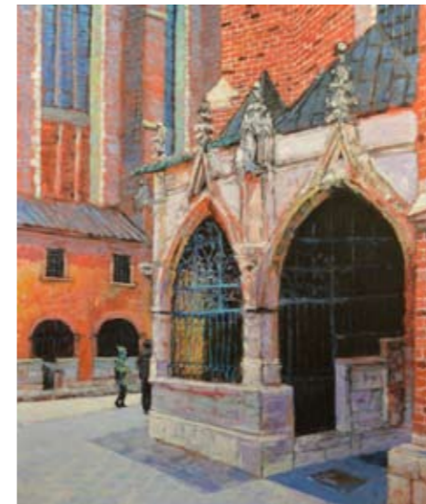
9. Ogród św. Barbary